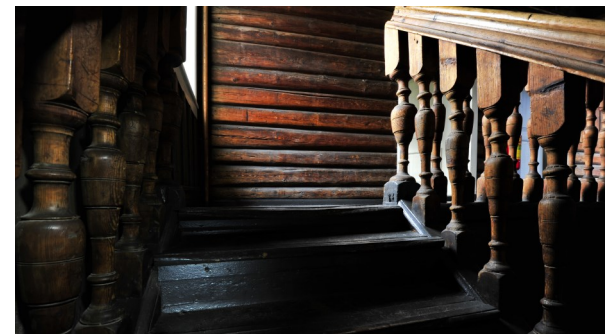
12. november blir det kveldsvandring i Herregården.